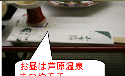
お昼は芦原温泉 まつや千千