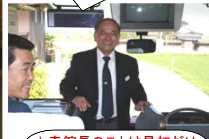
小森館長のことは最初だけ でした。通常通りビール、つ まみ飲み放題、食べ放 題・・。 朝から幸せな気分。