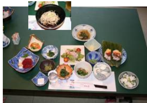
* さしみは馬刺しです。