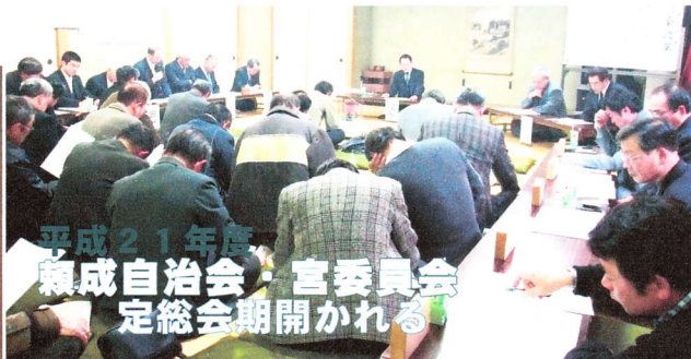
平成二十一年度 頼成自治会・宮委員会 定総会期開かれる

引き続き宮委員会の総会が行われ、祭礼祭事費二十三万円を主とする総額七十二万円の予算案が可決されました。終了後、和やかに直会が催され、情報交換や四方山の話に花が咲きました。