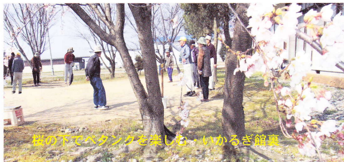
桜の下でペタンクを楽しむ、いかるぎ館裏

さわやかに風薫る五月になりました。先月中旬からは咲き誇る桜の下で、ペタンクの練習が開始されました。いかるぎ館周辺の道ばたには、薄紅色の芝桜が咲きそろって、地域環境美化の成果が目に見えて現れてきました。