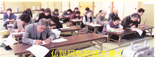
仏説阿彌陀経を書く

について御講話をされました。当日は好天に恵まれ四十人ほどの熱心な信者が参集されました。参拝者には供物の赤飯と萬松堂の煎餅が振る舞われました。