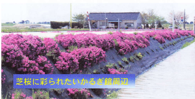
芝桜に彩られたいかるぎ館周辺