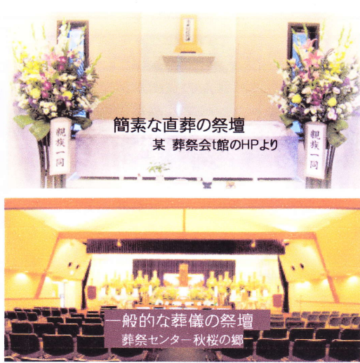
簡素な直葬の祭壇

このような様々な要因が絡みあい、信心深い富山県でも今後、直葬は増えると関係者はみている。