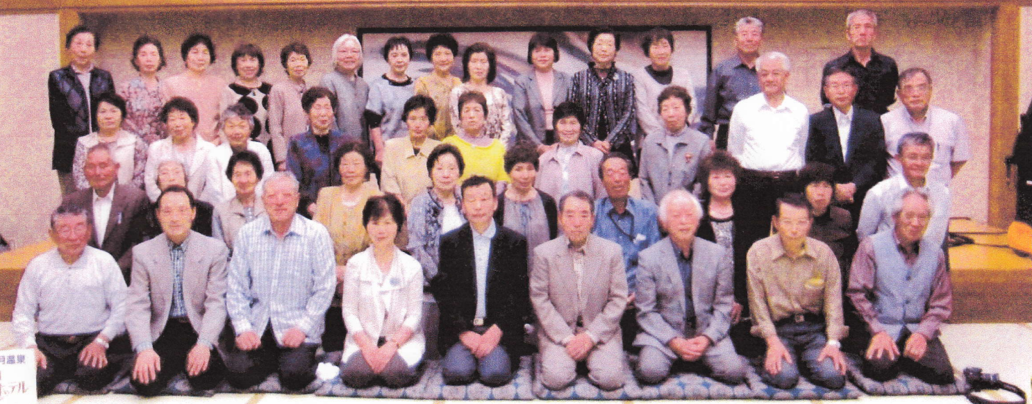
光寿会日帰り旅行 平成25年5月22日 宇奈月ホテルニューオオタニ