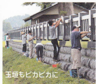
玉垣もピカピカに