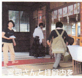
宮さんと拝殿内を