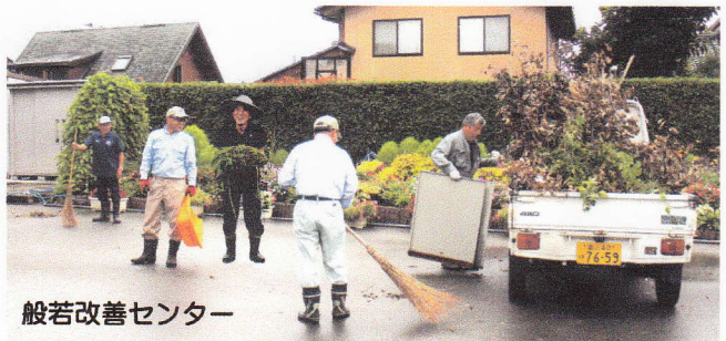
般若改善センター

男性は外回り女性中は内回りを担当し、除草や不要物の撤去、トイレ掃除、雑巾がけなど、およそ一時間をかけてすみすまですつきりとクリーンアップされ見違えるようになりました。