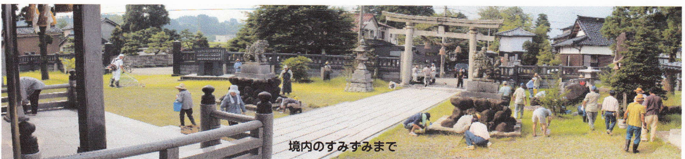
境内のすみすまで

数日来、猛暑が続いており、当日も朝から三十度近いような暑さになりました。皆さん汗まみれの作業となりましたが、お陰様でお盆を控えたお宮さんが見違えるほどきれいになりました。参加された地区民・光寿会役員・宮委員の皆様方ご苦労様でした。