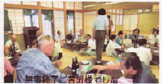
無事終了ご苦労様でした