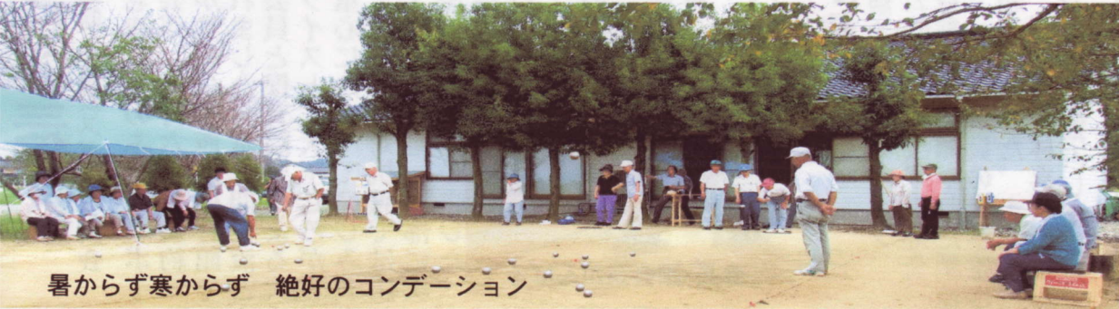
暑からず寒からず 絶好のコンディション